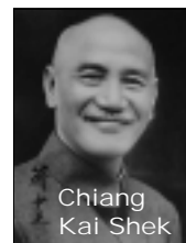
Chiang Kai Shek

8235 missionari tra il 1920 e il 1930, la Cina divenne sempre di più il terreno di lotta di due opposte fazioni: da un lato, c'erano i