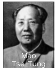
Mao Tse Tung

La lotta politica portò alla vittoria dei comunisti e all'espatrio di tutti i missionari operanti in Cina. Nel 1949, con la proclamazione della Repubblica Popolare Cinese da parte di Mao sulla Piazza Tien An Men, cominciò la stagione più coraggiosa dell'evangelicalismo cinese.